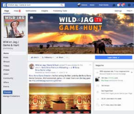
Plasings op ons sosiale media platforms